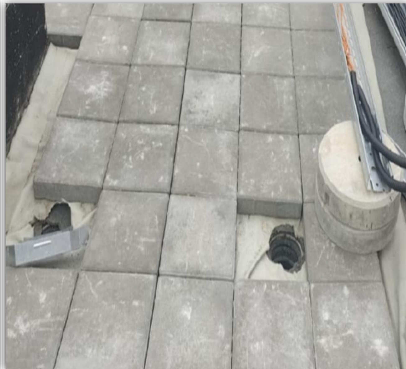
Демонтированы решетки водосточных воронок