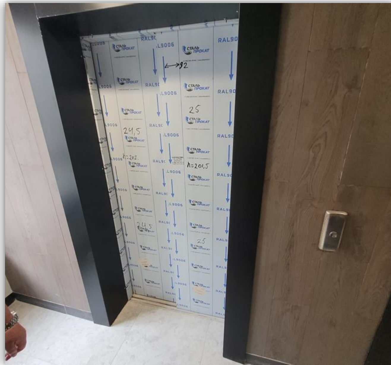
В связи с выходом из строя платы управления не работают 2 из 25 лифтов