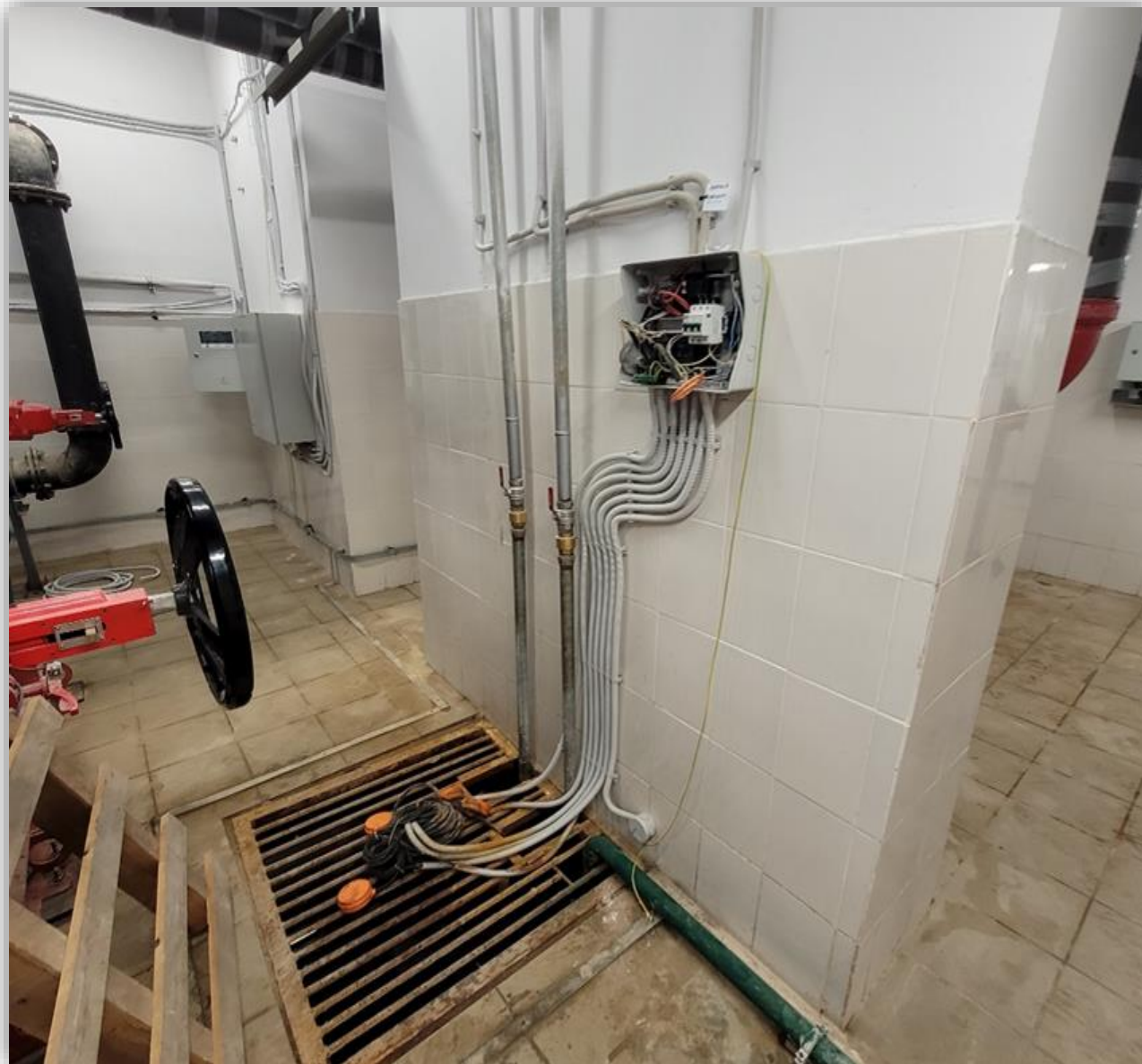
Сломана крышка шкафа управления дренажного насоса водомерного узла