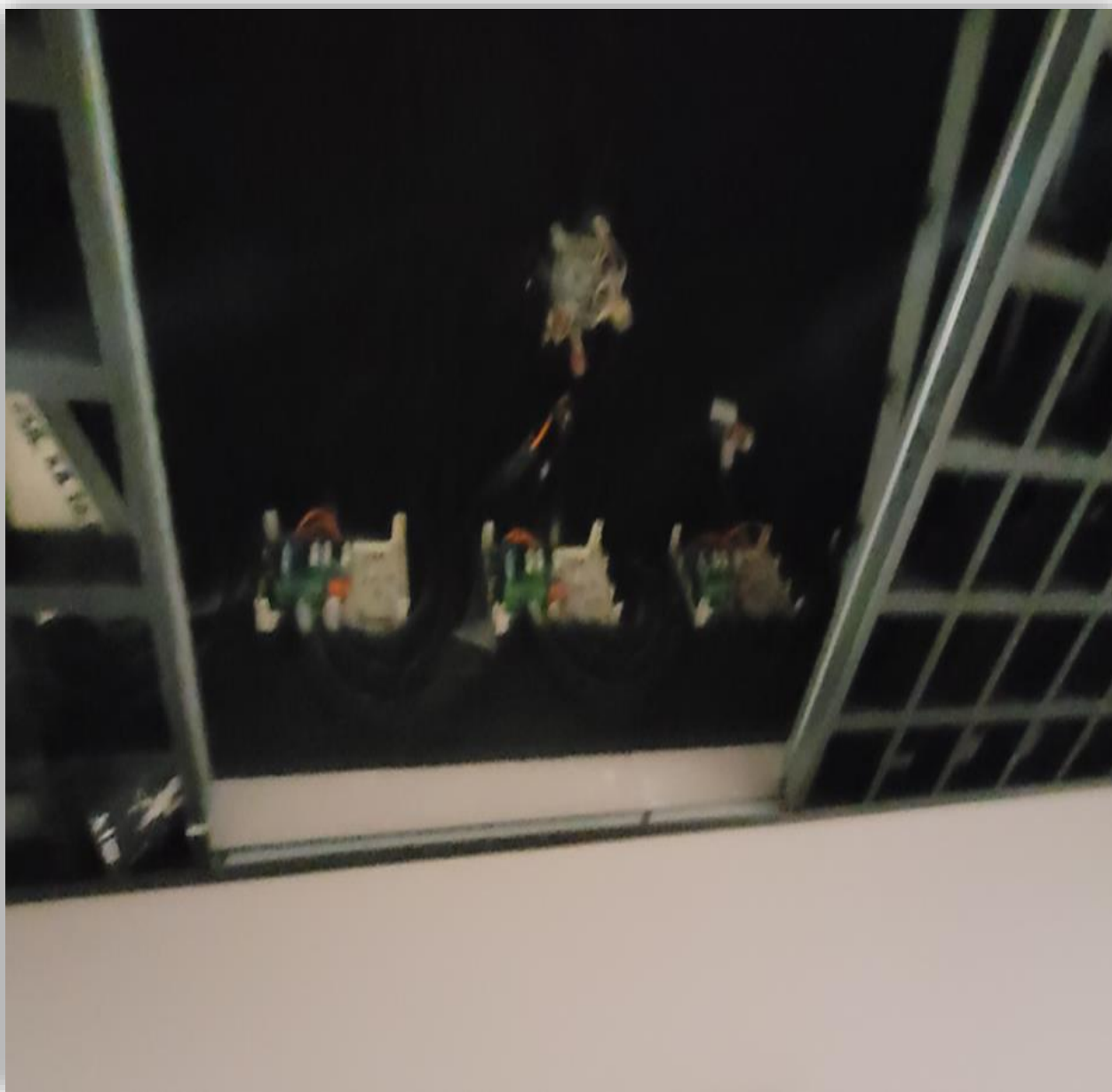
Сняты защитные крышки с блоков (сигнально-пусковых) управления огнезадерживающими клапанами