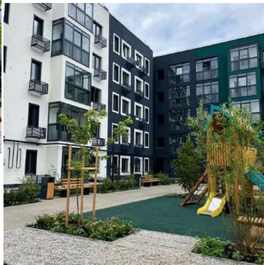
Фотографии первой очереди жилого комплекса